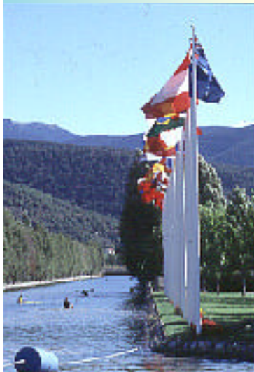
Copa del Mundo de Slalom en La Seu d'Urgell.